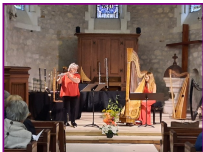
Les concerts au Temple d'Arcachon.