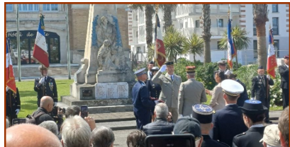
Gujan-Mestras (Guy Auriol)

Nous étions présents à Gujan et Arcachon pour la cérémonie commémorative du 08 mai