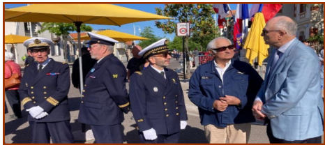
Arcachon (Serge Banzet)