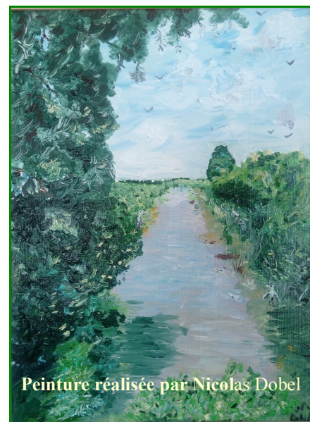
Peinture réalisée par Nicolas Dobel

Nous devons poursuivre nos efforts. Pourquoi ne pas commencer par prier ensemble pour ce temps de la création, au culte ou dans nos réunions ? Le Seigneur ne nous demande rien d'impossible. Avec Lui rien ne l'est. Tous, avec nos dons complémentaires, agissons ! Portons le souffle de l'Esprit, celui du changement dans notre Église et sur la terre !